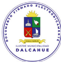
ALCALDESA DE LA COMUNA DALCAHUE