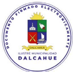
SECRETARIA MUNICIPAL DALCAHUE

ANÓTESE, Y ARCHÍVESE A LA DIRECCIÓN DE ADMINISTRACIÓN Y FINANZAS.