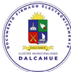
ALCALDESA DE LA COMUNA DALCAHUE