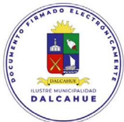
SECRETARIA MUNICIPAL DALCAHUE