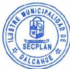
CAMILO ENRIQUE SOTO SOTO Secplan Ilustre Municipalidad de Dalcahue