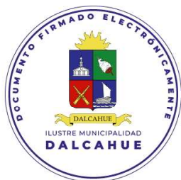
SECRETARIA MUNICIPAL DALCAHUE

ANÓTESE, COMUNÍQUESE A OFICINA DE ORGANIZACIONES COMUNITARIAS Y A CARABINEROS DE CHILE (TENENCIA DE DALCAHUE), PUBLÍQUESE Y ARCHÍVESE.