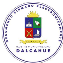
ALCALDESA DE LA COMUNA DALCAHUE