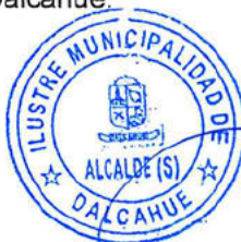
MANUEL ANÍBAL ÁLVAREZ BARRÍA ALCALDE (S) ILUSTRE MUNICIPALIDAD DE DALCAHUE