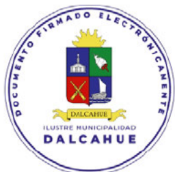
SECRETARIA MUNICIPAL DALCAHUE

ANÓTESE, Y ARCHÍVESE A LA DIRECCIÓN DE ADMINISTRACIÓN Y FINANZAS.