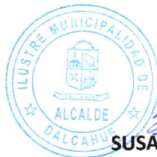
SUSANA ELIZABETH VERA CÁRCAMO Alcalde de la Comuna DALCAHUE