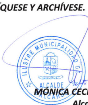
MÓNICA CECILIA BUSTAMANTE LEIMBACH Alcalde de la comuna (s) DALCAHUE