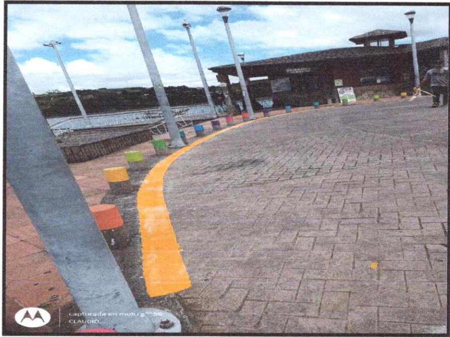
Calle Pedro Montt - Camino interior muelle artesanal.