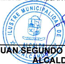
JUAN SEGUNDO HIJERRA SERON ALCALDE MUNICIPALIDAD DE DALCAHUE