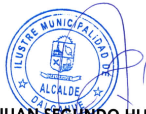
JUAN SEGUNDO HIJERRA SERÓN ALCALDE DE LA COMUNA DALCAHUE