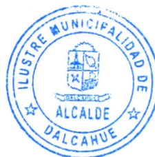
JUAN SEGUNDO HIJERRA SERÓN ALCALDE DE LA COMUNA DALCAHUE