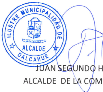
JUAN SEGUNDO HIJERRA SERÓN ALCALDE DE LA COMUNA DALCAHUE