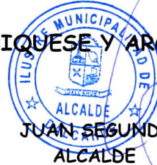
JUAN SEGUNDO HIJERRA SERON ALCALDE DE LA COMUNA DALCAHUE