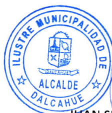
JUAN SEGUNDO HIJERRA SERÓN ALCALDE DE LA COMUNA DALCAHUE