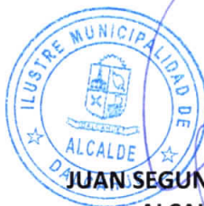
JUAN SEGUNDO HUERRA SERÓN ALCALDE COMUNA DALCAHUE