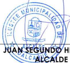
JUAN SEGUNDO HIJERRA SERÓN ALCALDE COMUNA DE DALCAHUE