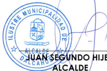
JUAN SEGUNDO HIJERRA SERÓN ALCALDE COMUNA DE DALCAHUE