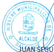
JUAN SEGUNDO HIJERRA SERÓN ALCALDE DE LA COMUNA DE DALCAHUE