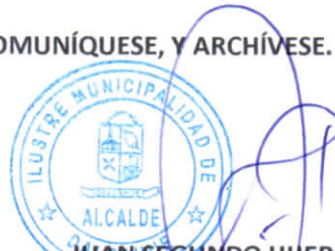
JUAN SEGUNDO HIJERRA SERÓN ALCALDE DE LA COMUNA DALCAHUE