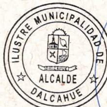
JUAN SEGUNDO HIJERRA SERON ALCALDE DE LA COMUNA DALCAHUE