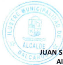
JUAN SEGUNDO HIJERRA SERON Alcalde de la Comuna Dalcahue