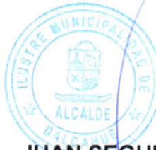
JUAN SEGUNDO HIJERRA SERON ALCALDE DE LA COMUNA