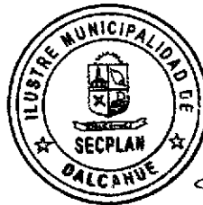
CAMILO ENRIQUE SOTO SOTO Secplan Ilustre Municipalidad de Dalcahue