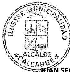
ALCALDE DE LA COMUNA Dalcahue