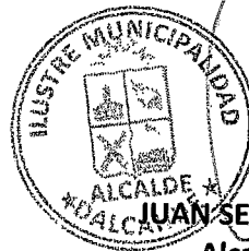
JUAN SEGUNDO HIJERRA SERÓN Alcalde de la Comuna DALCAHUE