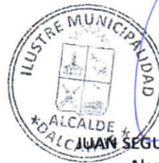
JUAN SEGUNDO HIJERRA SERON Alcalde de la Comuna Dalcahue