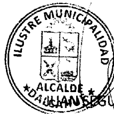
ALCALDE DE LA COMUNA DE DALCAHUE