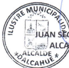
JUAN SEGUNDO HIJERRA SERÓN ALCALDE DE LA COMUNA