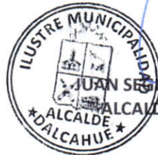
JUAN SEGUNDO HIJERRA SERÓN ALCALDE DE LA COMUNA DALCAHUE