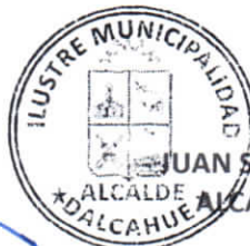
JUAN SEGUNDO HIJERRA SERÓN ALCALDE ALCALDE DE LA COMUNA