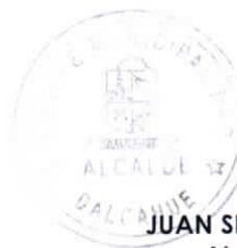
JUAN SEGUNDO HIJERRA SERÓN Alcalde de la Comuna DALCAHUE