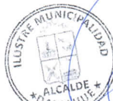
JUAN SEGUNDO HIJERRA SERÓN Alcalde de la Comuna DALCAHUE