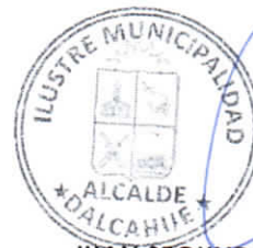
JUAN SEGUNDO HIJERRA SERÓN Alcalde de la Comuna DALCAHUE