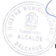
REGINA PATRICIA SOTO NAIL Alcalde de la Comuna (S) DALCAHUE