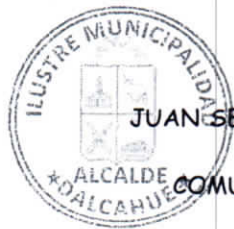
JUAN SEGUNDO HIJERRA SERON ALCALDE COMUNA DE DALCAHUE