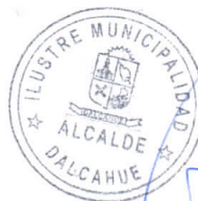
JUAN SEGUNDO HIJERRA SERÓN Alcalde de la Comuna DALCAHUE