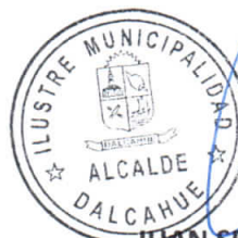
JUAN SEGUNDO HIJERRA SERÓN ALCALDE DE LA COMUNA