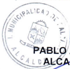
PABLO ANDRES LEMUS PEÑA ALCALDE DE LA COMUNA(S) DALCAHUE