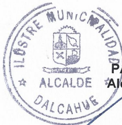
PABLO LEMUS PEÑA Alcalde (S) de la Comuna DALCAHUE