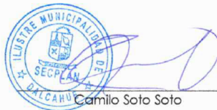
Camilo Soto Soto SECPLAN