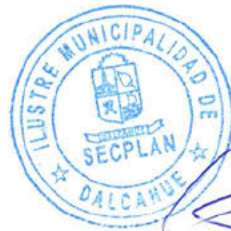
Camilo Soto Soto SECPLAN